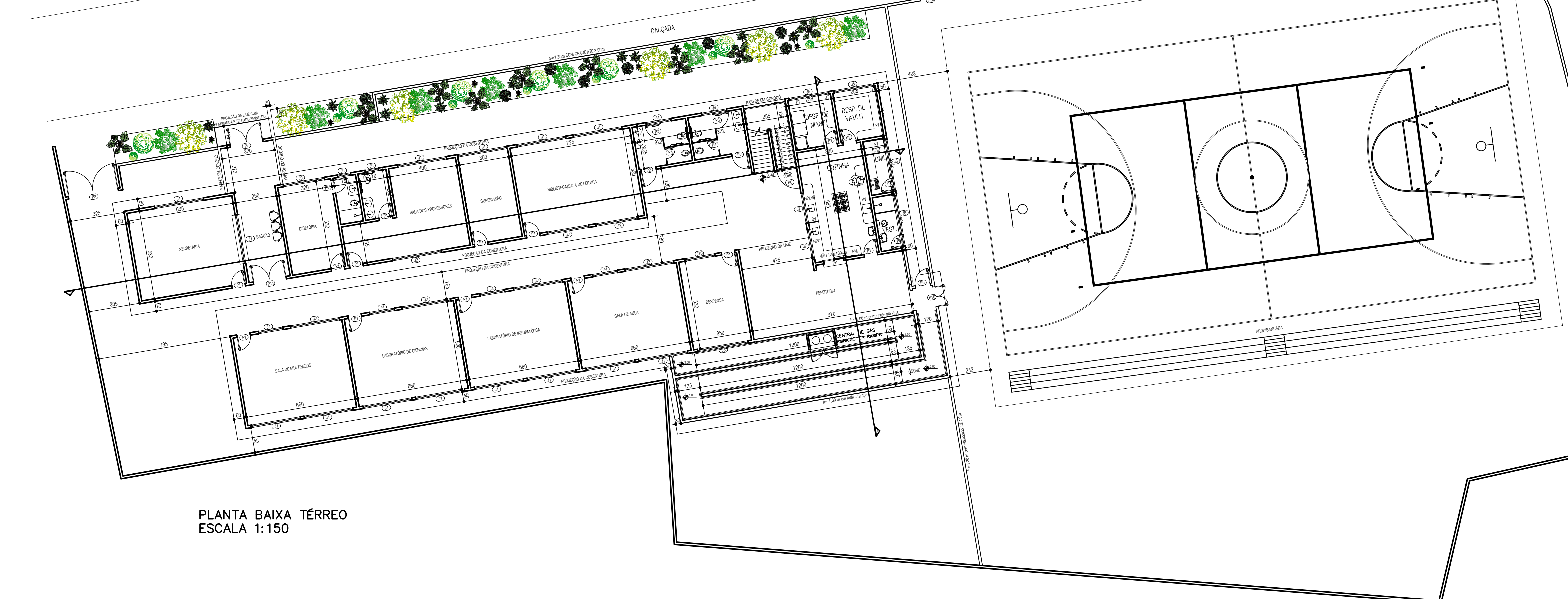
PLANTA BAIXA TÉRREO ESCALA 1:150