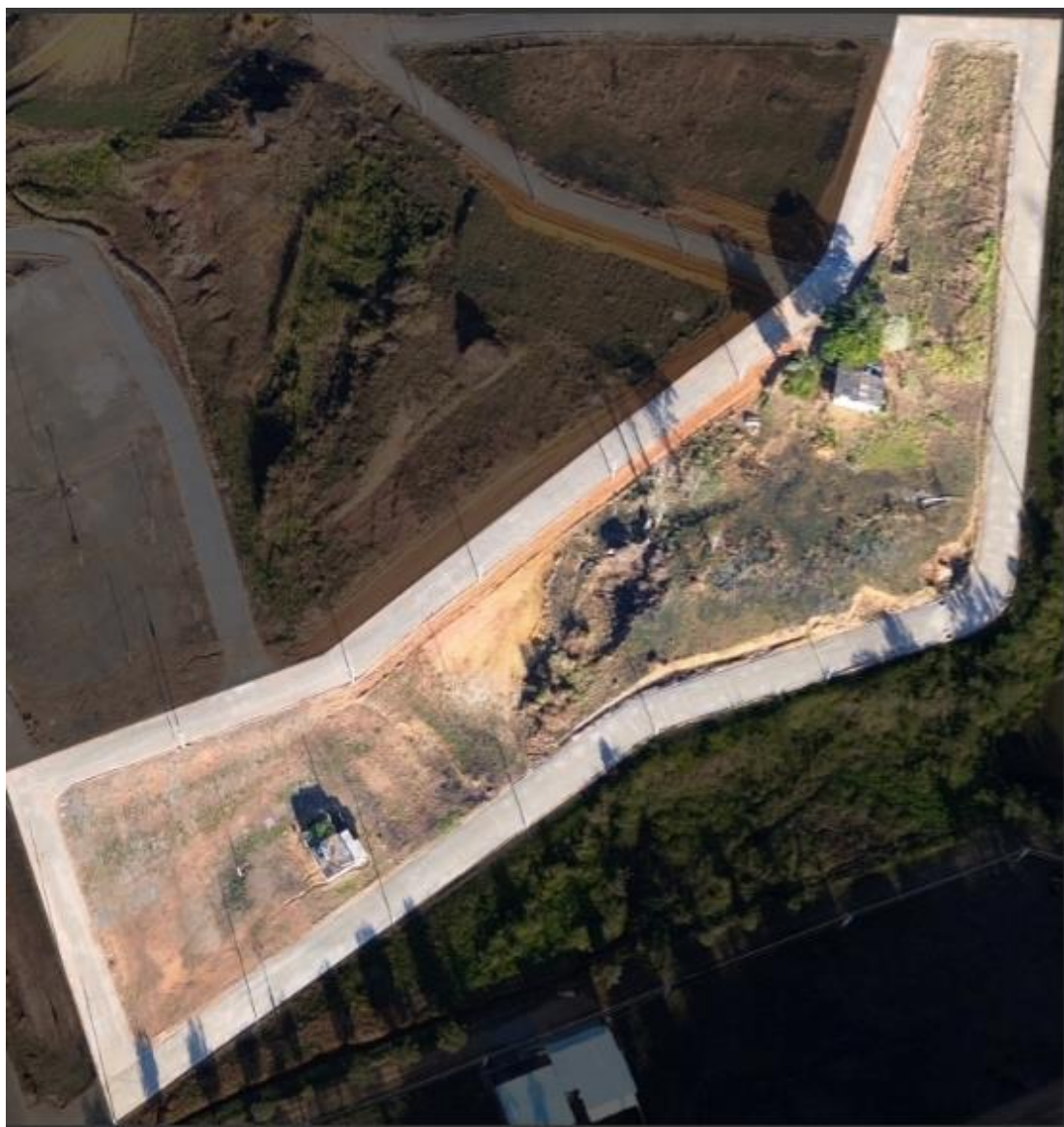
IMAGEM DESTACADA DA QUADRA A:

32, 33, 34, 35, 36, 37, 38, 39, 40, 41, 42, 43, 44, 45, 46, 47, 48 e 49 (Fichas nº 007 da Matrícula 3.941)